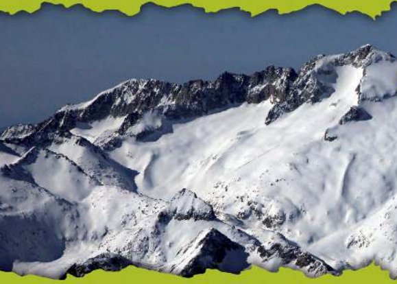
Aneto Maladeta. E. Guallart.

Le Parc Naturel de Posets-Maladeta s'étend au-dessus de trois vallées les plus orientales des Pyrénées aragonaises, celle de Barrabés à l'est, frontalière et partagée entre l' Aragon et la Catalogne; celle de Benasque dans le centre et celle de Chistau à l'ouest. L'altitude du Parc oscille entre les 1.500 mètres dans la vallée et les 3.404 mètres au pic de l'Aneto. En plus du Parc Naturel il y a d'autres espaces protégés, comme la Zone de Protection Spéciale pour les Oiseaux (ZEPA), Lieu d'Importance Communautaire (LIC), Réserve de Chasse et de trois Monuments Naturels des Glaciers Pyrénéens.