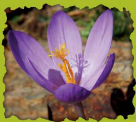
Crocus mudiflorus. L. Palacio.

La vie dans le Parc s'échelonne en fonction de l'altitude et les conditions de l'environnement. Dans une altitude inférieure on peut trouver des espèces telles que des sorbiers, des noisetiers et des bouleaux. Sur les versants les plus humides poussent des hêtres, des pins et des sapins et aux points les plus élevés, le pin sylvestre cède sa place au pin noir qui est la dernière espèce que l'on peut trouver dans les étages alpin et nival, où les conditions de vie sont très difficiles. Les prés et les pâturages, avec leurs caractéristiques laissent le passage à la roche nue, partiellement couverte de lichens.