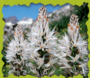
Gamón. L. Palacio.