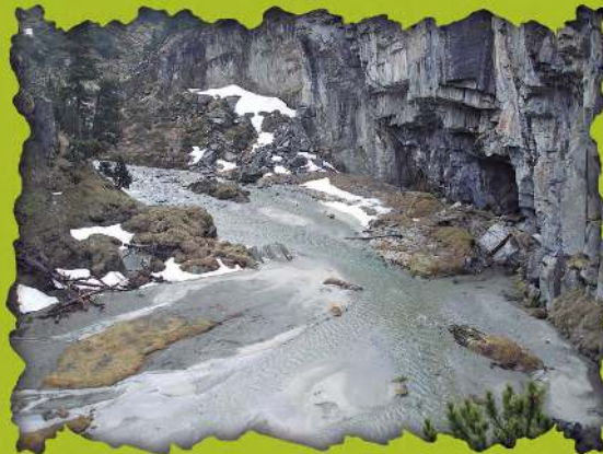
Forau de Aiguallut. M. Antequera.

Les glaciers quaternaires furent les principaux agents érosifs qui ont formé ce paysage. Ils sculptèrent sur les granits, les calcaires et les ardoises de longues vallées en forme de U, des cirques colossaux et de profondes cuvettes, occupés actuellement par des centaines de "ibones", nom sous lequel on connaît ces lacs de montagne d'origine glaciaire. Il faut souligner la gouffre du Forau de Aiguallut, par où disparaissent les eaux du glacier de l'Aneto qui réapparaissent, après avoir coulé 4 km. sous terre, pour alimenter la rivière de Garonne dans le val voisin d'Aran.