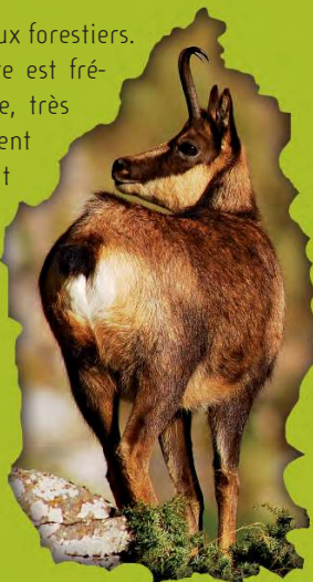
Sarrío. L. Palacio.

Une faune variée abrite dans les milieux forestiers. La présence de la fouive et la martre est fréquente. Il abonde aussi la marmotte, très facile à détecter grâce à son sifflement perçant, ou l'isard, comme on connaît en Aragon le chamois. Comme des espèces singulières et difficiles à apercevoir on peut trouver le grand tétras, dont le mâle est particulièrement coloré, l'hibou boréal ou la perdrix nivale dont le plumage devient blanc pour faire du mimétisme avec la neige.